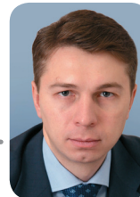
Андрей Бральнин , Мэр г. Котласа

— Сегодня для людей дела крайне важны площадки взаимодействия, коммуникации, на которых они могут встречаться, знакомиться, находить общие интересы и начинать совместные проекты. Такие площадки существуют в виде отраслевых форумов и конференций, а издатели календаря-справочника «Первые Лица» поддерживают аналогичную площадку в виде печатного издания, которое всегда под рукой. Это инструмент коммуникации, которым пользуются и предприниматели, и представители власти. Они оценивают его пользу, поскольку проект живёт, развивается, набирает популярность и всё больше участников.